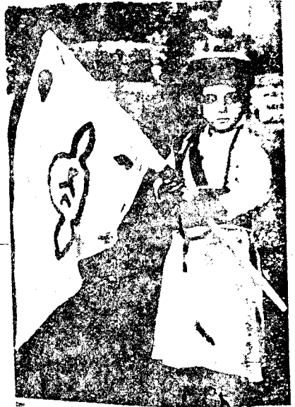
ولي الله أشرف الرفاعي الحسيني